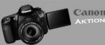
FOTO ROLI FOTO • VIDEO • TV • HiFi Kaufplatz • 3930 Visp • Tel. 027 946 22 35 www.fotoroli.ch • info@fotoroli.ch

Beim Kauf einer Canon 60D oder 600D inkl. Objektiv bezahlen wir Ihnen für ihre alte Kamera bis zu sFr. 200.-